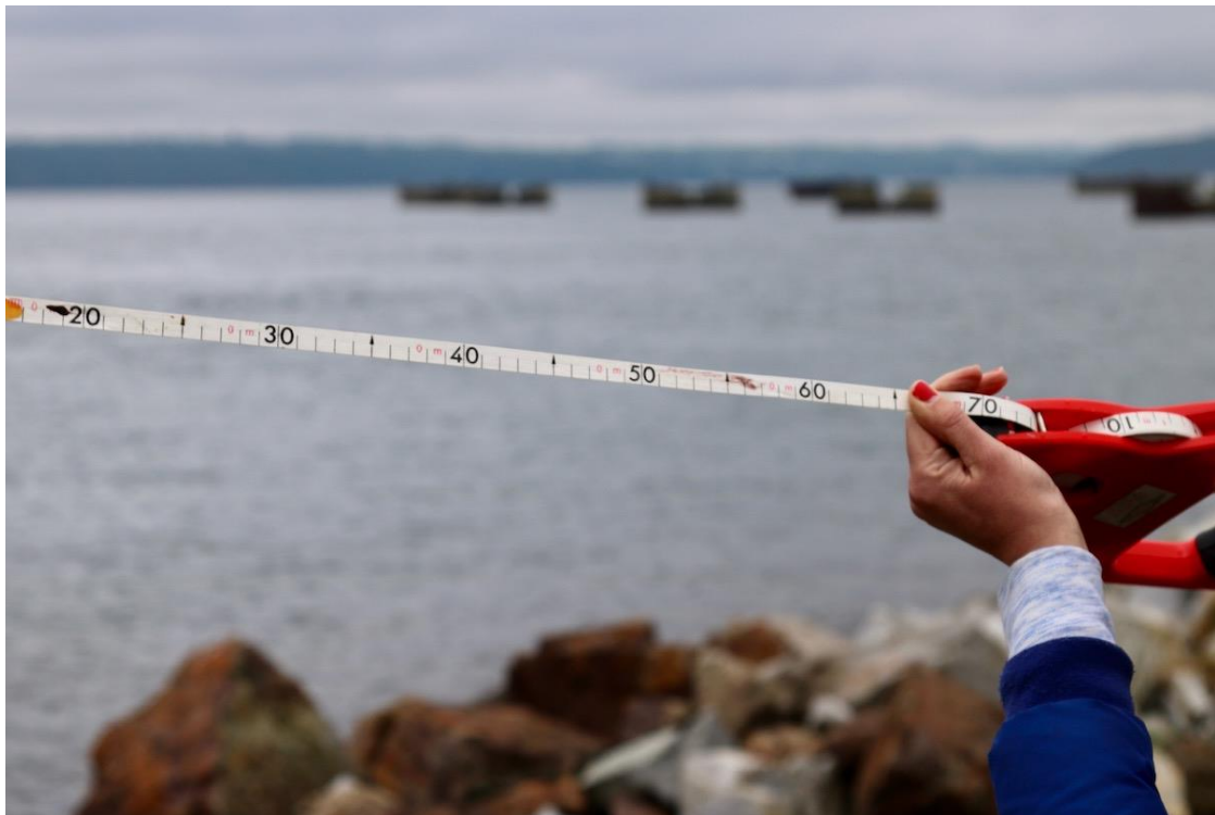
FIGURE 4 Mesurer à Lanvéoc (Festival Ex-Île) -Finistère.

Si chaque mesure « montre qu'elle ne sera qu'une "aiguille dans une botte de foin" [...] chaque acte posé vient bousculer les déterminismes et les inerties en réintégrant la complexité et l'infini des possibilités » 11