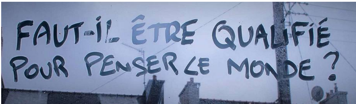
FIGURE 5 « Faut-il être qualifié pour penser le monde ? »

Pour Lionel Jaffrès, une des problématiques du théâtre est souvent de s'adresser à des gens déjà convaincus. Mais il y a des moyens pour dépasser cela, comme travailler avec des amateurs, élargir les publics.