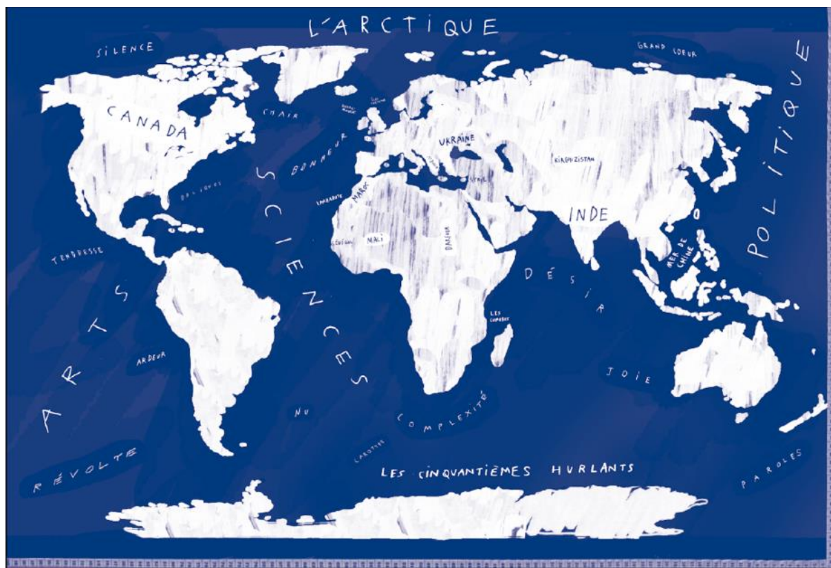
FIGURE 3 « Mesurer la taille du monde ».