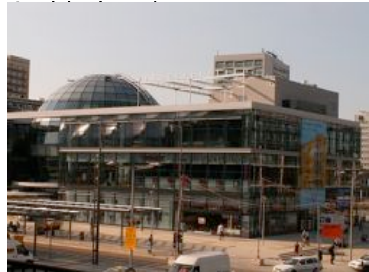
Kugelhaus am Wiener Platz S L. Hatzfeldt