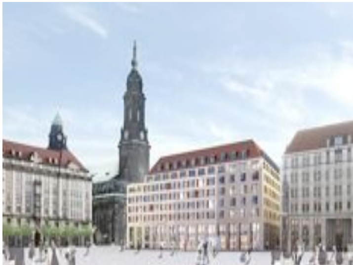
Hotel am Altmarkt (von Pfau Architekten)