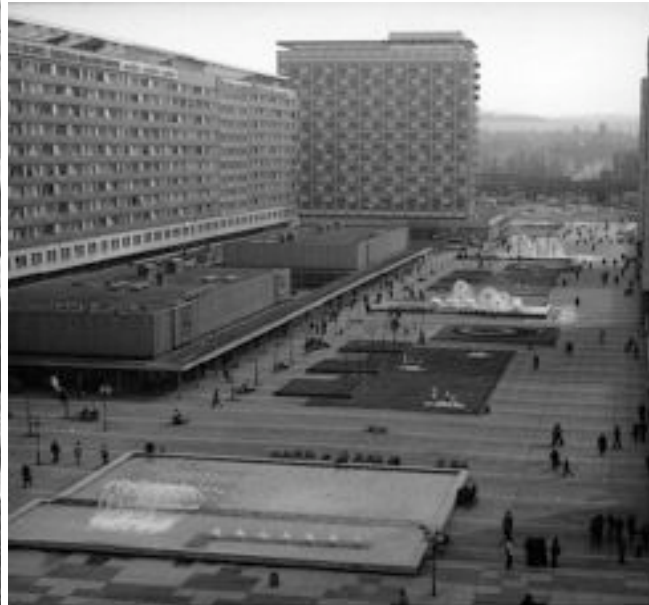
© Deutsche Fotothek - Preview Scan vom Kirtaxibogen