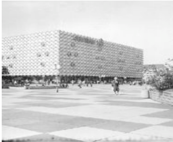
© 2014 by the Estate of Frank Gehry + Partners. All rights reserved.