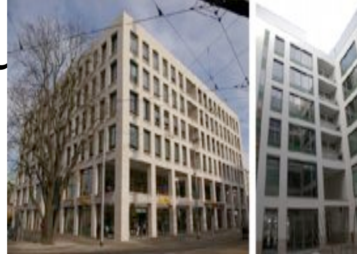
Wildsruffer Kubus (nbhg