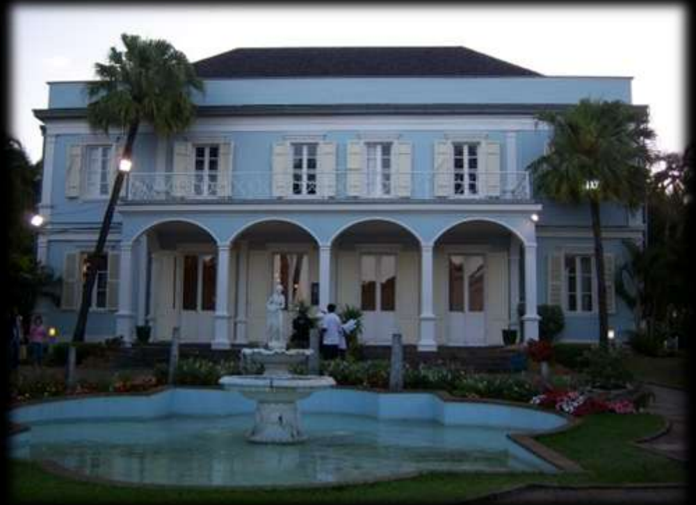
Saint Denis, fleuron de l'architecture coloniale

→ Nous apporte des éléments d'analyse sur l'évolution du rapport aux patrimoines dans leur interconnexion avec le champ identitaire.