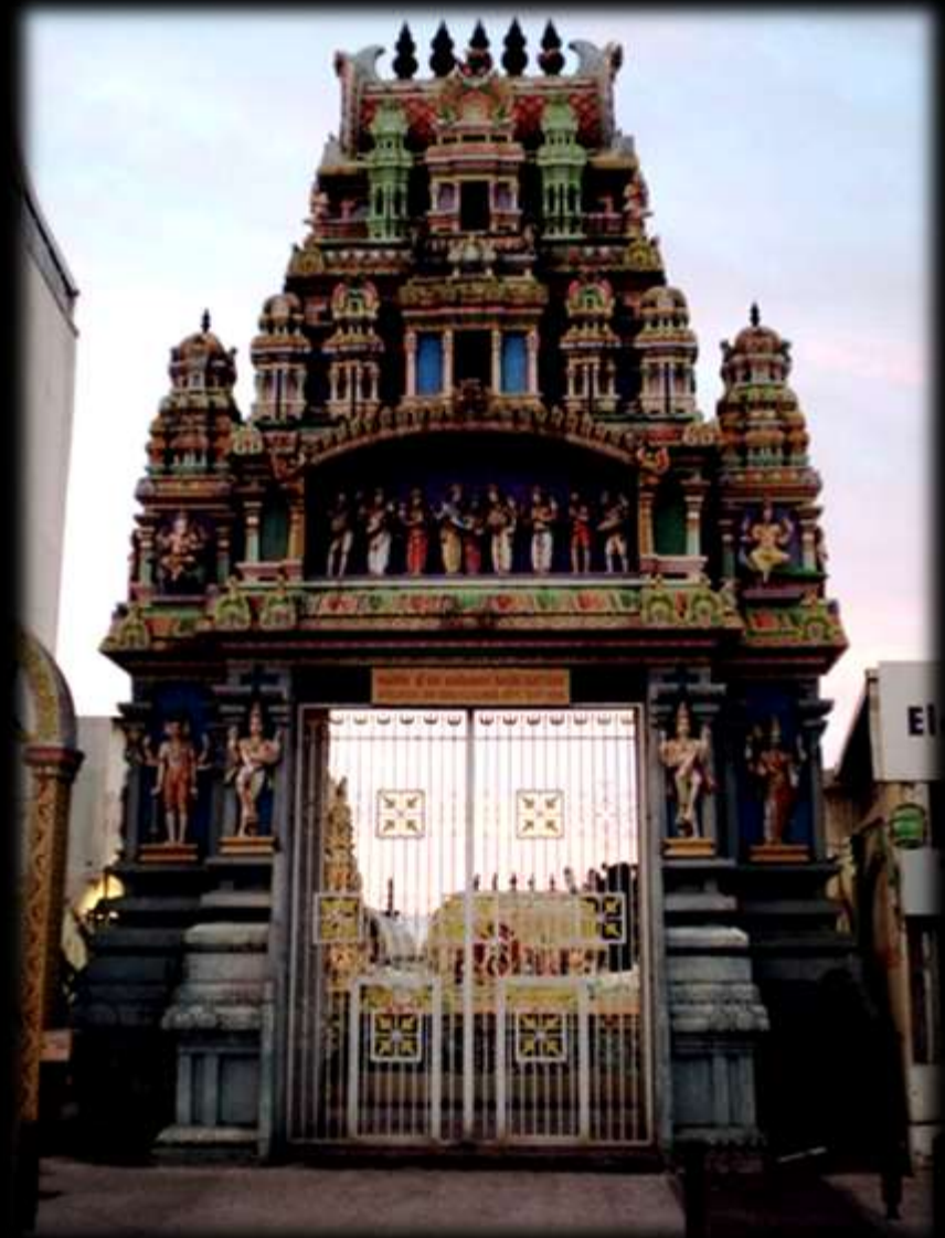
Le temple Hindou Kalikambal, installé à l'ancienne entrée Est de la ville, rue du Maréchal Leclerc