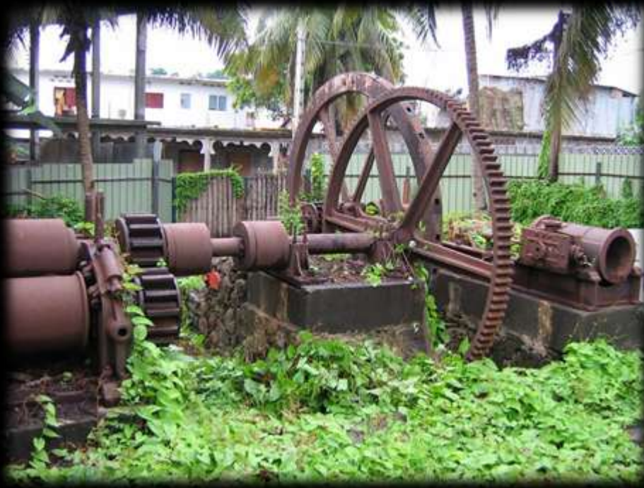
Vestiges d'usine sucrière perdus dans la ville. Kavani, Mamoudzou.

Certaines catégories de patrimoines bâtis présentes dans la ville ne sont pas mises en valeur.