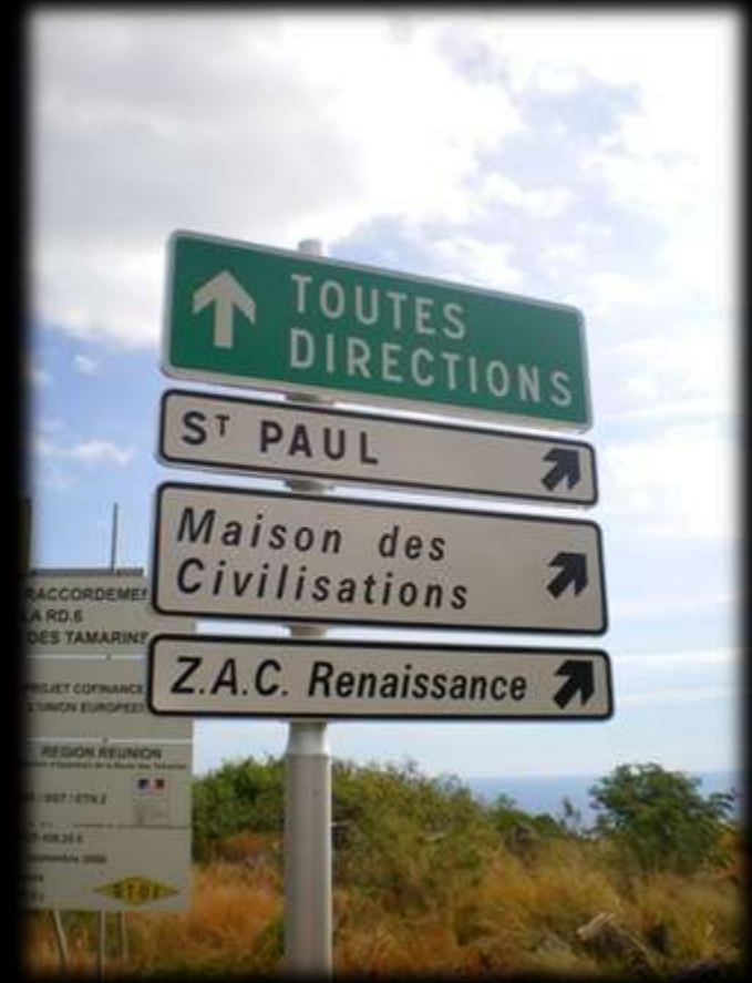
Panneau de signalisation de la Maison des Civilisations et de l'Unité Réunionnaise (MCUR)... Alors même que le projet n'a jamais pu voir le jour – août 2009.