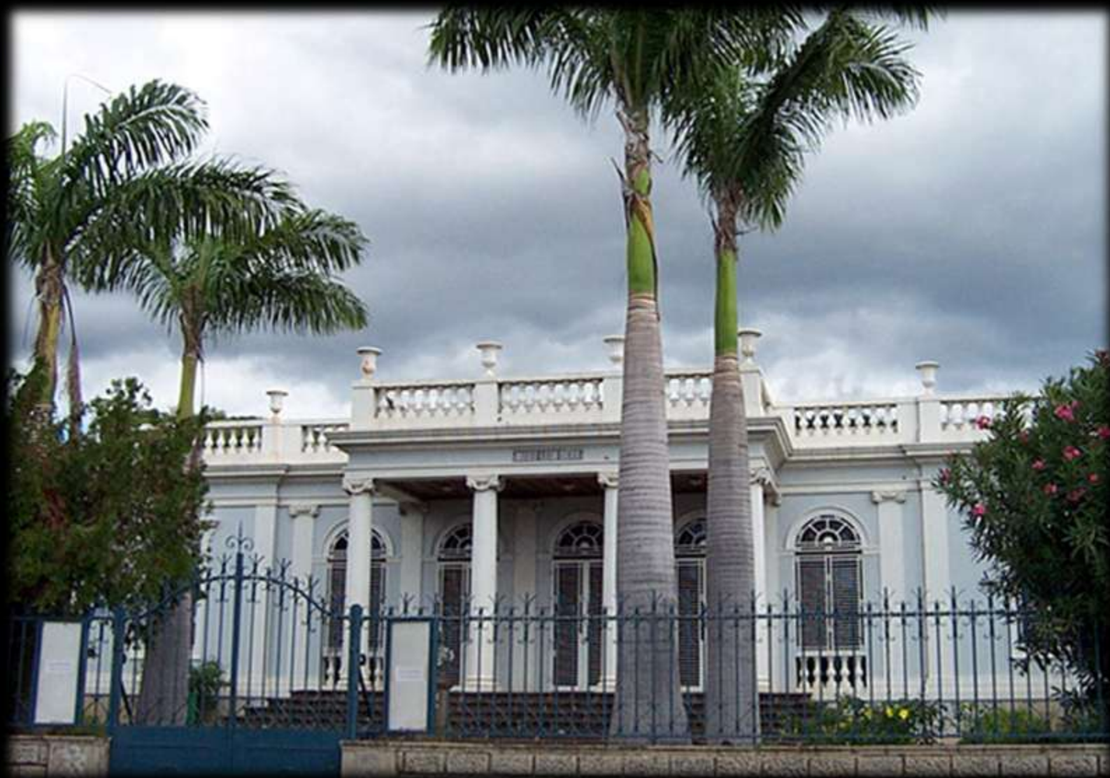
Musée Léon Dierx, dans la Rue de Paris