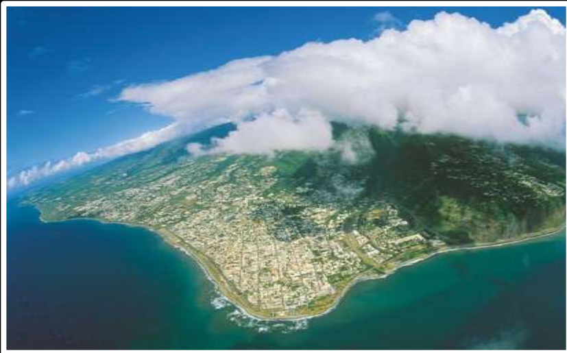
Saint Denis de La Reunion

Communication présentée le 7 octobre 2010, dans le cadre du Séminaire PCEU à l'ENS