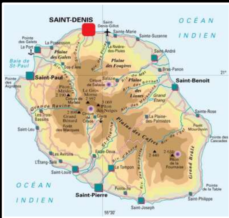
Localisation de Saint Denis (Nord de La Reunion)