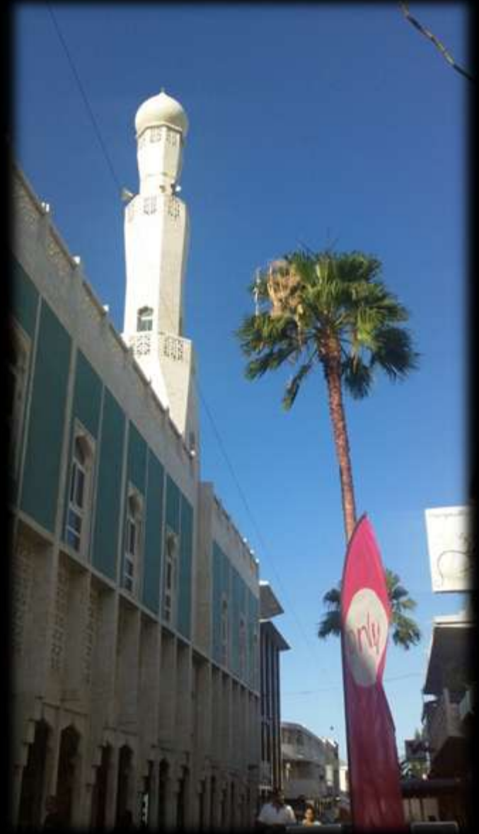
La mosquée Noor-e-Islam et son minaret, dans la Rue Maréchal Leclerc, principale artère commerçante de St Denis

Ce qui marque principalement l'organisation spatiale du centre ville de Saint Denis est la pluralité et la visibilité des lieux de cultes sur une même zone.